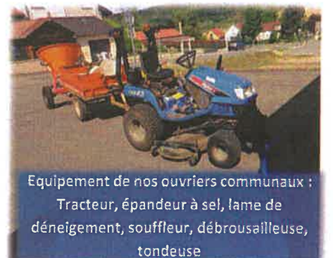
Équipement de nos ouvriers communaux : Tracteur, épandeur à sel, lame de dénivelage, souffleur, débroussailluse, tondeuse