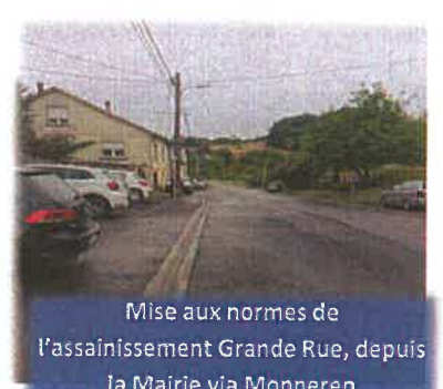
Mise aux normes de l'assainissement Grande Rue, depuis la Mairie via Monneren