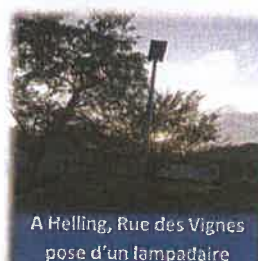
A Helling, Rue des Vignes pose d'un lampadaire