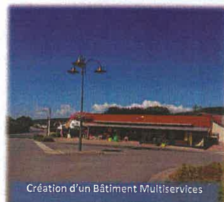
Création d'un Bâtiment Multiservices