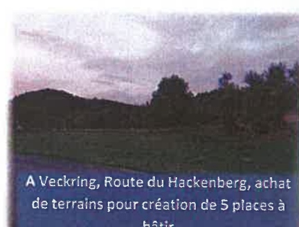
A Veckring, Route du Hackenberg, achat de terrains pour création de 5 places à bâtir