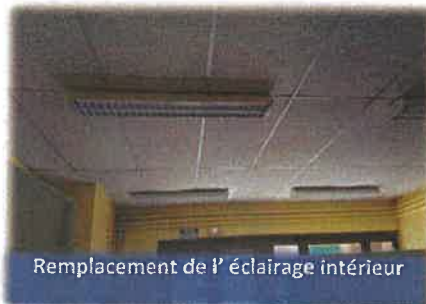
Remplacement de l'éclairage intérieur