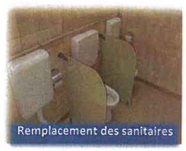
Remplacement des sanitaires