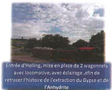
Entrée d'Helling, mise en place de 2 wagonnets avec locomotive, avec éclairage, afin de retracer l'histoire de l'extraction du Gypse et de l'Anhydrite