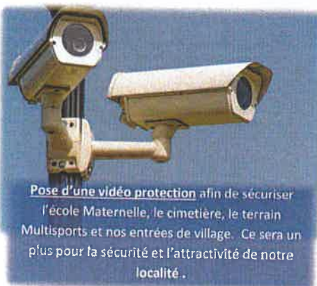
Pose d'une vidéo protection afin de sécuriser l'école Maternelle, le cimetière, le terrain Multisports et nos entrées de village. Ce sera un plus pour la sécurité et l'attractivité de notre localité.