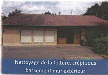
Nettoyage de la toiture, crépi sous bassement mur extérieur