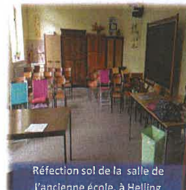
Réfection sol de la salle de l'ancienne école, à Helling