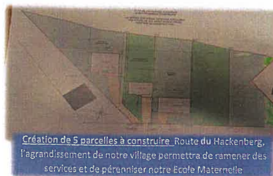
Création de 5 parcelles à construire Route du Hackenberg, l'agrandissement de notre village permettra de ramener des services et de pérenniser notre Ecole Maternelle