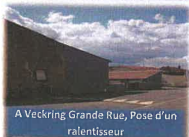
A Veckring Grande Rue, Pose d'un ralentisseur