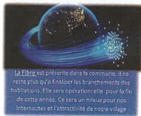
La Fibre est présente dans la commune, il ne reste plus qu'à finaliser les branchements des habitations. Elle sera opérationnelle pour la fin de cette année. Ce sera un mieux pour nos internautes et l'attractivité de notre village