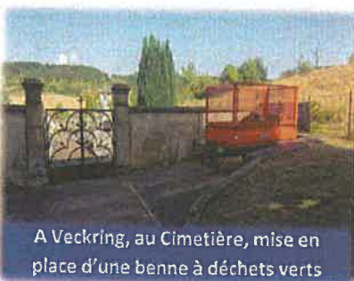
A Veckring, au Cimetière, mise en place d'une benne à déchets verts