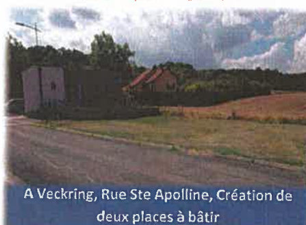
A Veckring, Rue Ste Apolline, Création de deux places à bâtir