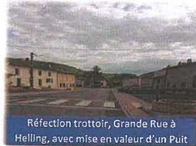
Réfection trottoir, Grande Rue à Helling, avec mise en valeur d'un Puit