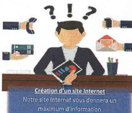
Création d'un site Internet Notre site Internet vous donnera un maximum d'information