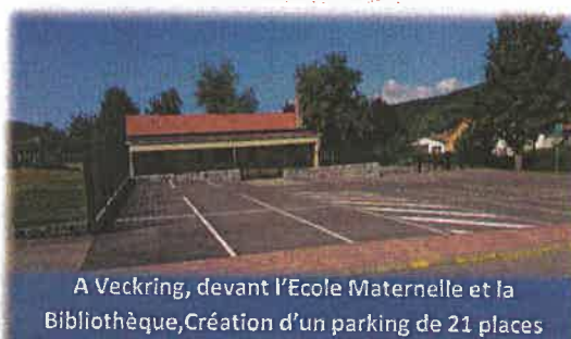
A Veckring, devant l'Ecole Maternelle et la Bibliothèque, Création d'un parking de 21 places