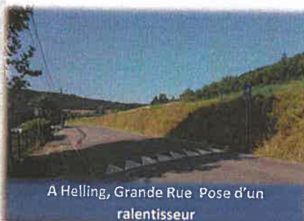
A Helling, Grande Rue Pose d'un ralentisseur