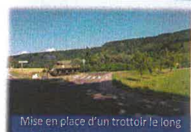
Mise en place d'un trottoir le long de la RD 60 pour nos marcheurs