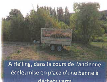
A Helling, dans la cours de l'ancienne école, mise en place d'une benne à déchets verts