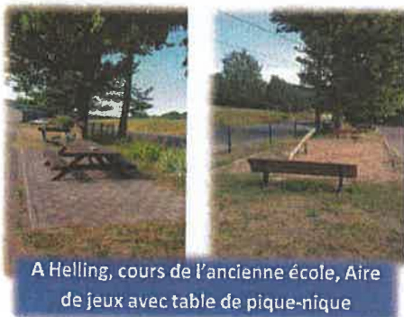
A Helling, cours de l'ancienne école, Aire de jeux avec table de pique-nique