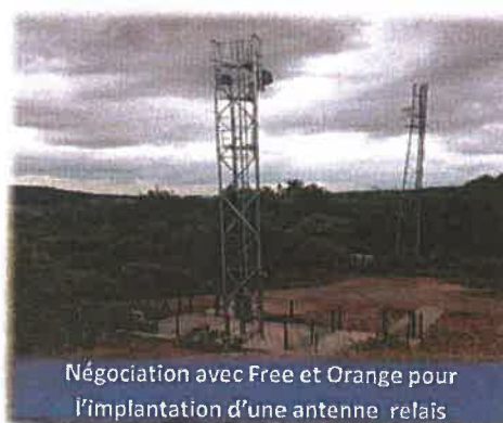
Négociation avec Free et Orange pour l'implantation d'une antenne relais