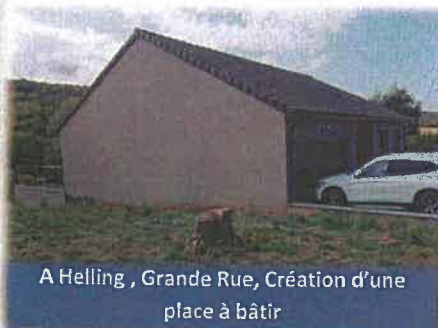
A Helling , Grande Rue, Création d'une place à bâtir