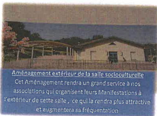
Aménagement extérieur de la salle socioculturelle Cet Aménagement rendra un grand service à nos associations qui organisent leurs Manifestations à l'extérieur de cette salle, ce qui la rendra plus attractive et augmentera sa fréquentation