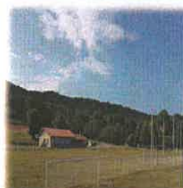
Mise en place main courante avec filet de protection, prise en compte de l'entretien de la pelouse et des abords du terrain de foot par la Municipalité, travaux de réfection des sanitaires et vestiaires et remplacement chaudière