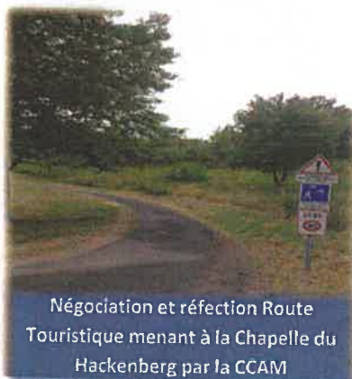
Négociation et réfection Route Touristique menant à la Chapelle du Hackenberg par la CCAM