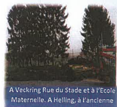
A Veckring Rue du Stade et à l'Ecole Maternelle. A Helling, à l'ancienne école, abattage de sapins