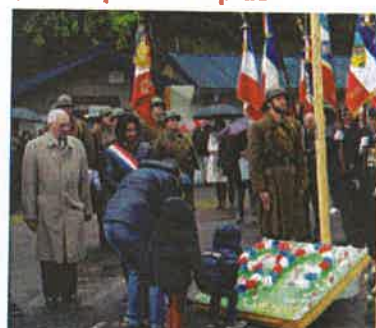
Importantes Cérémonies du Souvenir réalisées sur notre commune avec les enfants de nos écoles et de nombreux invités et élus