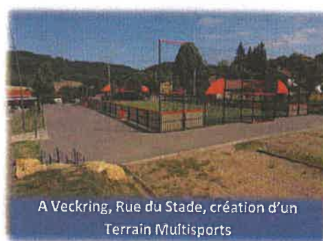
A Veckring, Rue du Stade, création d'un Terrain Multisports