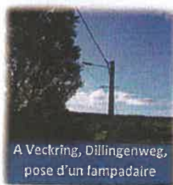
A Veckring, Dillingenweg, pose d'un lampadaire