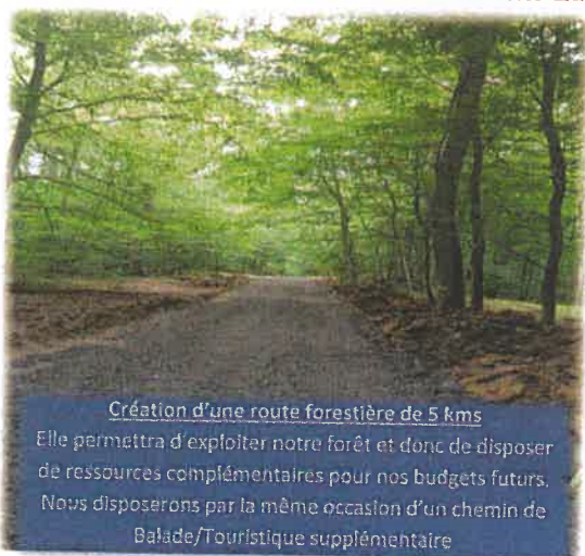
Création d'une route forestière de 5 kms Elle permettra d'exploiter notre forêt et donc de disposer de ressources complémentaires pour nos budgets futurs. Nous disposerons par la même occasion d'un chemin de Balade/Touristique supplémentaire

Les projets en cours qui devraient être terminés pour 2020, fin de notre mandat Électoral