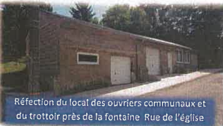
Réfection du local des ouvriers communaux et du trottoir près de la fontaine Rue de l'église