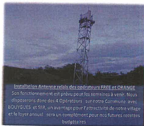
Installation Antenne relais des opérateurs FREE et ORANGE Son fonctionnement est prévu pour les semaines à venir. Nous disposerons donc de 4 Opérateurs sur notre Commune avec BOUYGUES et SFR, un avantage pour l'attractivité de notre village et le loyer annuel sera un complément pour nos futures recettes budgétaires