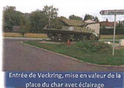
Entrée de Veckring, mise en valeur de la place du char avec éclairage